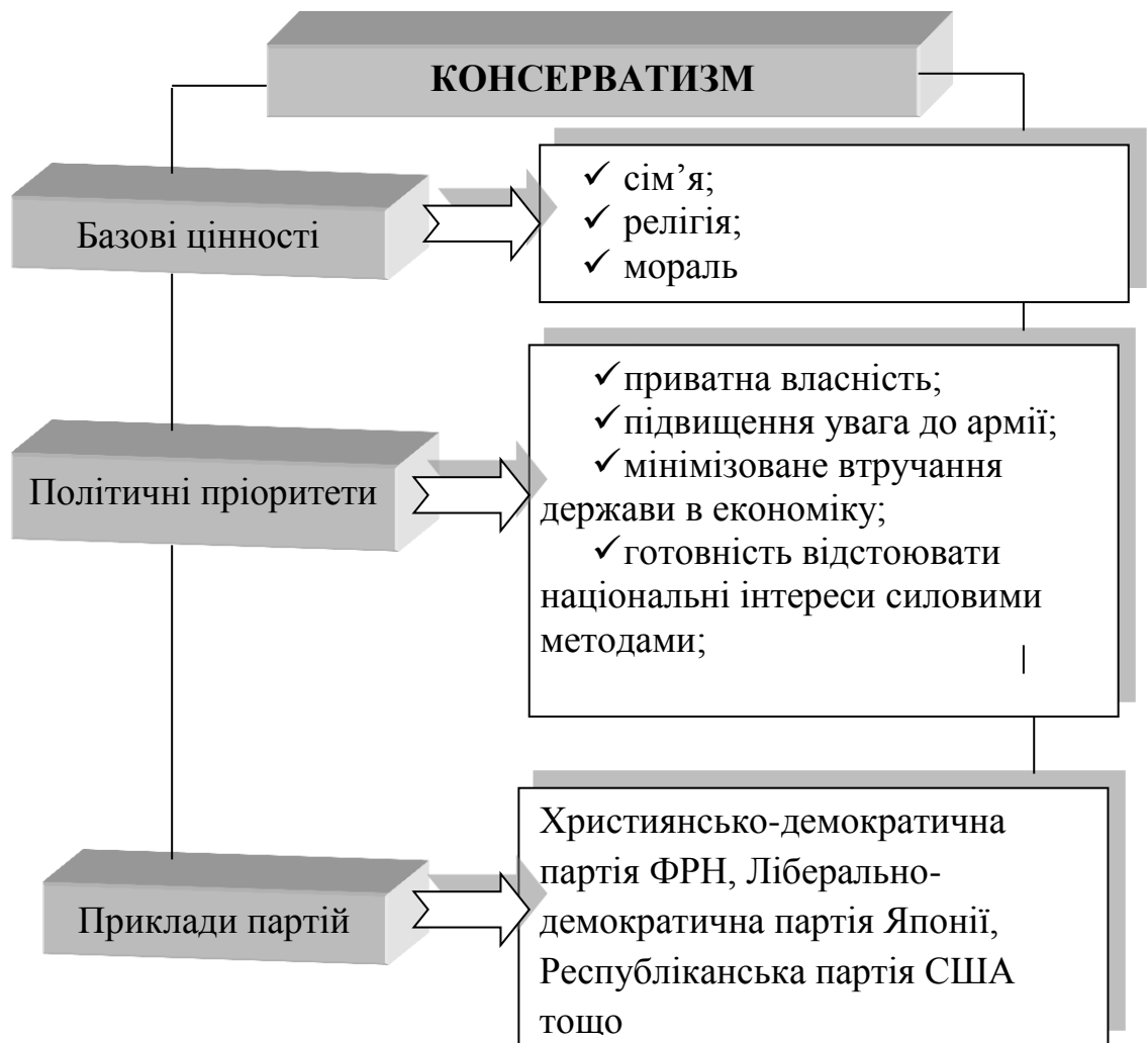
Рис. 1.3. Базові цінності, політичні пріоритети та приклади партій, що сповідують консерватизм

Він відображає ідеї, ідеали, орієнтації, ціннісні норми тих класів, фракцій і соціальних груп, становищу яких загрожують об'єктивні тенденції суспільно-історичного й соціально-економічного розвитку. Часто консерватизм виступає своєрідною захисною реакцією середніх і дрібних підприємців, фермерів, ремісників, які відчувають страх перед майбутнім.