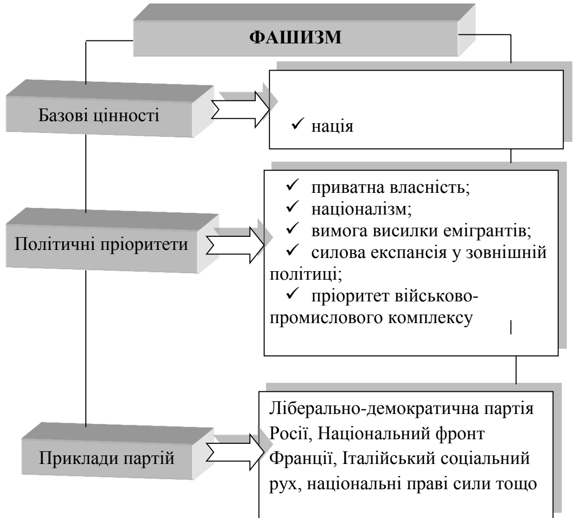
Рис. 1.5. Базові цінності, політичні пріоритети та приклади партій, що сповідують фашистську доктрину

нації як вищої і вічної реальності, заснованої на спільності крові. У сфері зовнішньої політики ця теорія расової зверхності слугувала обґрунтуванням політики імперіалістичних загарбвань і поневолення інших народів. Політичною формою фашистської держави є тоталітаризм. Необхідною умовою політичного панування визнається культ вождя.