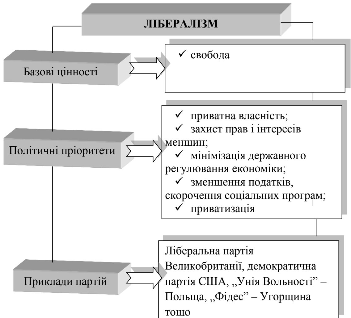
Рис. 1.4. Базові цінності, політичні пріоритети та приклади партій, що сповідують ліберальну доктрину

державою повинні мати договірний характер, а верховенство закону є інструментом соціального контролю. У кожному суспільстві громадянським свободам надається пріоритет над політичними, юридичними та моральними нормами.