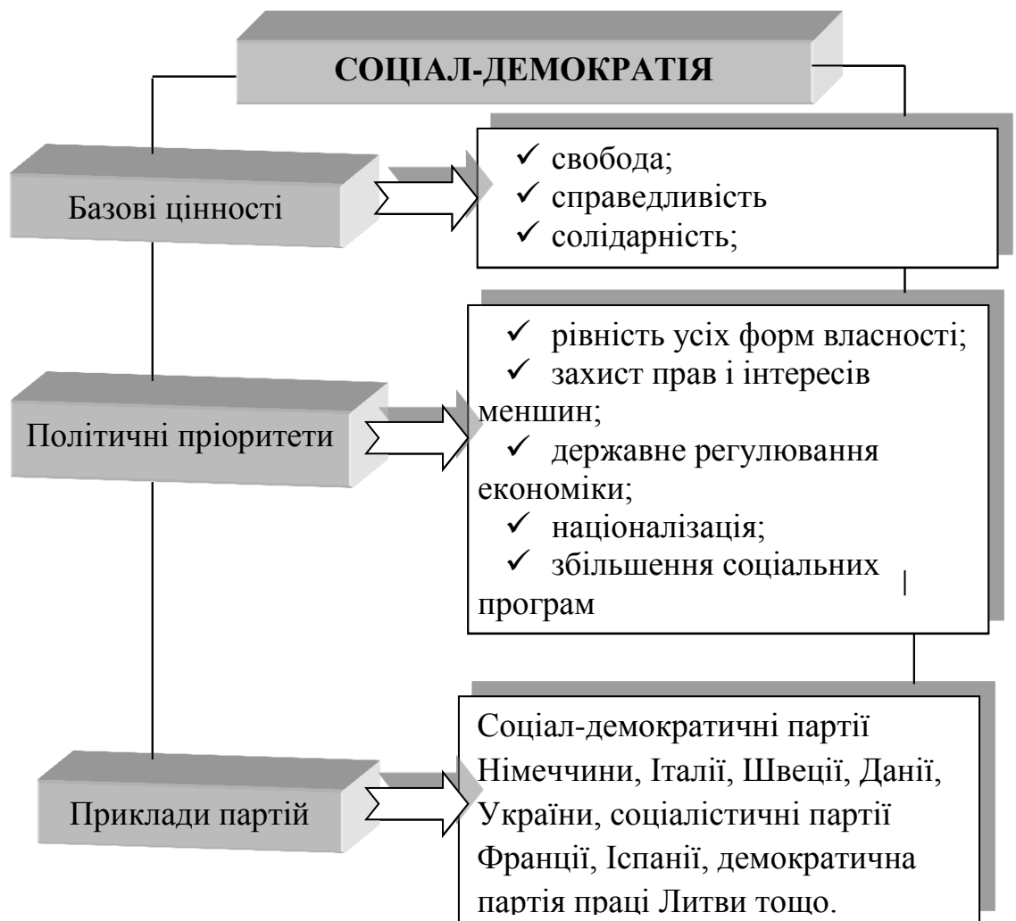
Рис. 1.2. Базові цінності, політичні пріоритети та приклади партій, що сповідують соціал-демократичну доктрину

Соціал-демократія як політична ідеологія активно виступає за здійснення в усіх сферах життя суспільства ідей демократичного соціалізму , ідеологічною основою якого є трансформація капіталізму в соціалізм шляхом перманентних реформ, поглиблення і розвитку демократії, а її базовими цінностями — такі загальнолюдські поняття, як свобода, гласність, демократія, справедливість, рівність та солідарність.