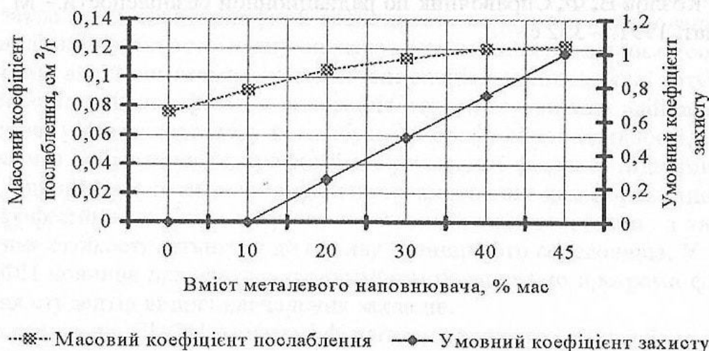
Рис. 2. Результати аналітичних і експериментальних досліджень зразків рентгено-захисних будівельних сумішей

Критерієм рентгено-захисних властивостей дослідного зразка було зображення на рентгенівській плівці металевго предмету розсташованого за екрануючим матеріалом і колір самого знімку. Для прив'язки отриманих результатів якісних характеристик послаблення випромінювань до кількісних величин був прийнятий умовний коефіцієнт захисту. Так за нульовий рівень екранування прийняли темні знімки з чітким білим зображенням металевго предмету, за одиницю – відсутність будь якого зображення на світлому фоні плівки (поток гамма-квантів поглинутий матеріалом зразка). По якості отриманих зображень отримані знімки розділили на 5 умовних значень коефіцієнту – 0; 0.25; 0.5; 0.75 і 1.0. Результати аналітичних розрахунків кількісних показників послаблення випромінювань і експериментальних досліджень представлені на рис.2.