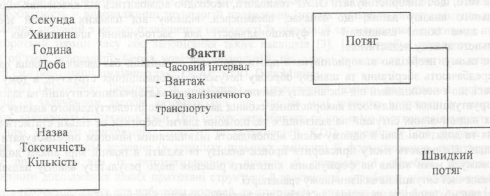
Рис. 2. Подання зв'язків предметної області «Хімічно-небезпечні надзвичайні ситуації на залізниці» у сховищі даних за схемою «сніжинка»

Схема «сніжинки» – це модифікація схеми «зірка». У цій схемі частина таблиць вимірів розбита на декілька зв'язаних таблиць. Це надає змогу більш гнучко проводити аналіз наявних фактів. Подання зв'язків у сховищі даних за схемою «сніжинка» наведено на рис. 2.