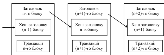
Рис. 1. Спрощена послідовність блоків

Blockchain – це розподілена структура даних, яка складається з послідовності блоків, в якій кожен блок містить хеш попереднього блоку, утворюючи, як наслідок, ланцюг блоків (рис. 1). Перший блок у ланцюжку (батьківський блок, genesis block) розглядають як окремий випадок, оскільки в нього відсутній попередній блок. Blockchain працює як розподілена база даних, яка здійснює облік усіх операцій у мережі. Операції мають відзначку часу і зберігаються у блоках, де кожен блок ідентифікується своїм криптографічним хешем. Blockchain повністю зберігається у кожному вузлі мережі. Для роботи Blockchain не потрібно довіри між вузлами мережі, оскільки будь-який вузол може самостійно перевірити, чи збігається його копія бази з копіями, які зберігаються в інших вузлах [14].