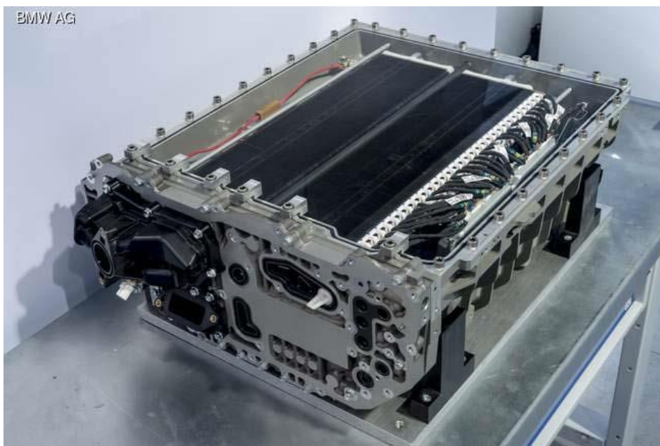
Рисунок 2 – Балон для водню

Балон для водню являє собою тонкий і довгий циліндр з композитних матеріалів, надійно захищений від розгерметизації. Він важить 160 кг і дозволяє вмістити до 7,1 кг водню.