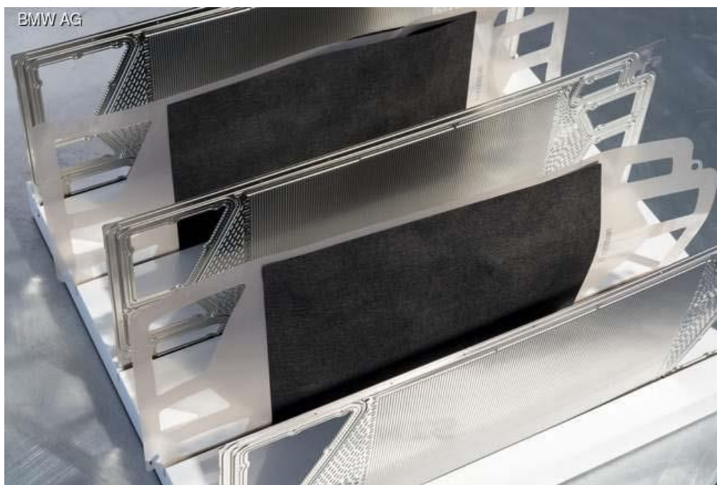
Рисунок 3 – Батарея паливних елементів

Батарея паливних елементів складається з набору паливних осередків, яких може бути від 200 до 400 штук. Кожна комірка складається з двох металевих пластин і спеціальної мембрани між ними. В результаті хімічної реакції між воднем і киснем, виділяється електроенергія, яка передається далі до електромотора, а вода, що утворюється в наслідок реакції відводиться від осередків по численним канавкам.