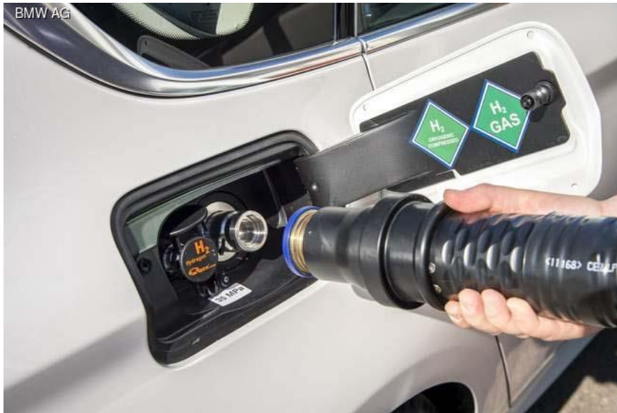
Рисунок 1 – Процес зарядки бака воднем займає не більше 5 хвилин [15]

Водень закачується в циліндричний балон під тиск 700 бар, який знаходиться в трансмісивному тунелі. Подібне розташування 160-кілограмового бака дозволяє не тільки знизити центр ваги і оптимізувати розподіл маси між осями, але і максимально захистити його в разі аварії. Крім того, корпус балона виконує функцію несучого елемента купе.