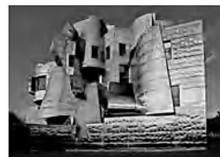
Weisman Art Museum, Minneapolis