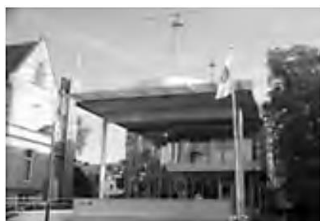
Museum für Kommunikation Frankfurt