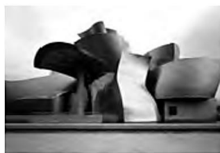
Guggenheim Museum Bilbao