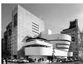
Solomon R. Guggenheim Museum