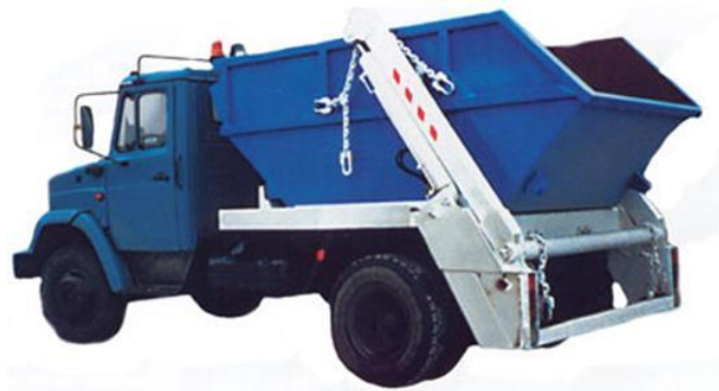
Рис. 3. Контейнерний сміттєвоз для контейнерів об'ємом 7,6 м 3 для збирання великогабаритних відходів

спеціально обладнаних транспортних засобів (контейнерних сміттєвозів) і контейнерів, як зображено на рис. 3 [21, 22].