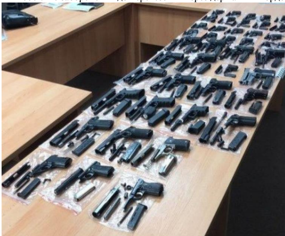
Зображення. Загальний вигляд вилученої зброї.

На даний час досить поширеним, є перевезення частин нарізної вогнепальної зброї та пістолетів замаскованих під пістолети для відстрілу патронів 4мм «Flobert», так у липні 2017 року співробітники СБУ затримали двох контрабандистів, коли ті намагалися незаконно ввезти 43 пістолети в розібраному стані марок «Glock», «Beretta», «Colt», «Browning», «CZ», «Astra», «Bersa». При цьому маскували ці пістолети для відстрілу патронів 4мм «Flobert»не заборонених до перевезення через державний кордон.