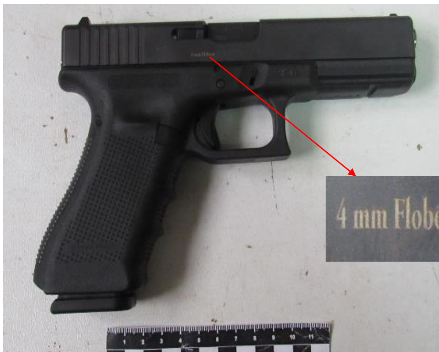
Пістолет, марки «Glock 17», 4-ї модифікації, серія та номер «BFHW635». На кожусі затвора пістолета наявні додаткові маркувальні позначення 4mm Flobert.