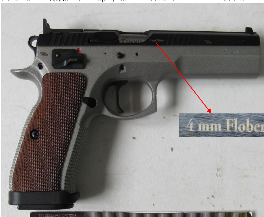
Пістолет марки «CZ 75 TS», серія та номер «С461642». На кожусі затвора пістолета наявні додаткові маркувальні позначення 4mm Flobert.