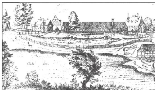
Рис. 1. Фільварок (гравюра XVII ст.)

Після проведення аграрної реформи 1557 р. («Устава на волоки»), українські землі поділялися на так звані волоки – ділянки розміром 16-21 га. Під фільваркове господарство виділялися кращі землі, зосереджені в одному місці.