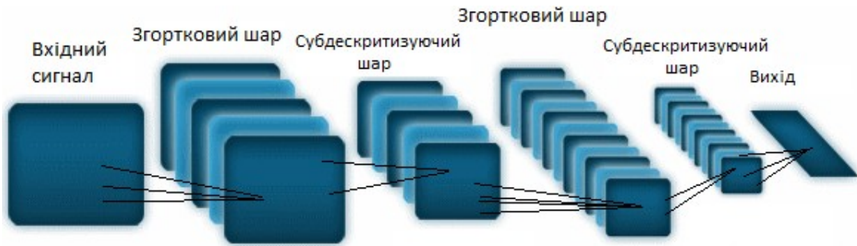
Рис. 1. Структура типової згорткової нейромережі

Згорткова нейронна мережа складається із шарів, які чергуються. Ядро згортки – це набір вагових коефіцієнтів. Для навчання згорткової нейронної мережі використовують алгоритм зворотного поширення помилки [3]. Навчання мережі починається із представлення образу на її вхід і обрахунку відповідної реакції. Порівняння із бажаною реакцією дає можливість змінювати ваги зв'язків так, щоб мережа на наступному кроці могла показати кращий результат. Правило, за яким відбувається навчання, забезпечує налаштування ваг зв'язків. Інформація з останнього шару мережі є вихідною для нейронів попередніх шарів. Ці нейрони можуть налаштовувати ваги для зменшення похибки на наступному кроці.