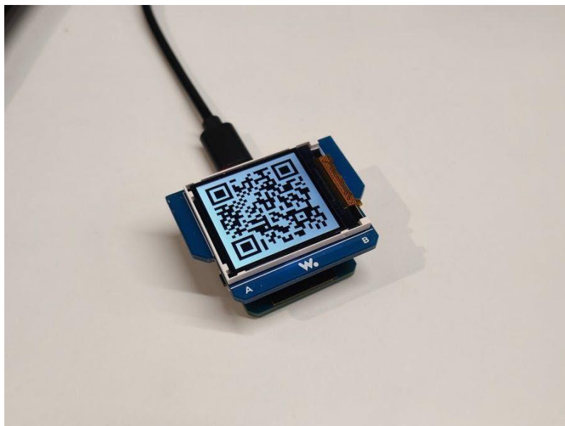
Рис. 2. Демонстрація способу відображення QR-коду за допомогою LCD дисплея

Також, окремо буде розглянуто спосіб створення засобів графічного безконтактного безготівкового розрахунку на базі мікроконтролерів серії STM32. На рисунку 2 висвітлено зовнішній вигляд QR-коду, відображеного на LCD дисплеї за допомогою описаного методу.