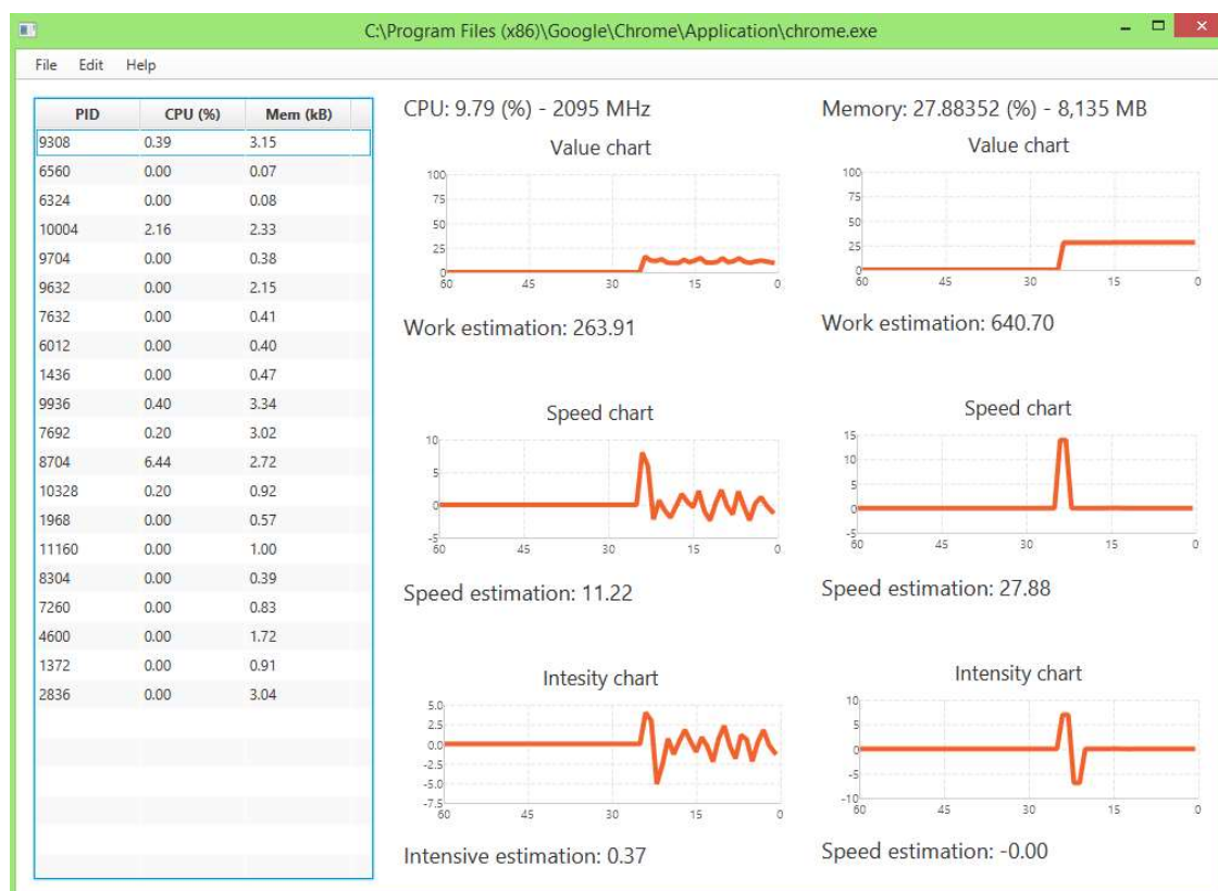
Рисунок 1 – Моніторинг роботи chrome.exe

На рисунку 1 зображено приклад вимірювання та оцінки продуктивності роботи прикладної програми.