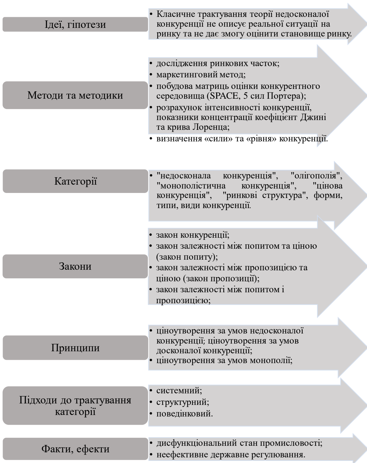
Рис. 4 Авторський концепт теорії недосконалої конкуренції

на нашу думку, в обґрунтуванні наукових засад формування державної регулятивної політики саме на основі принципових положень вказаної теорії, чого в Україні до цього часу практично не здійснювалося.