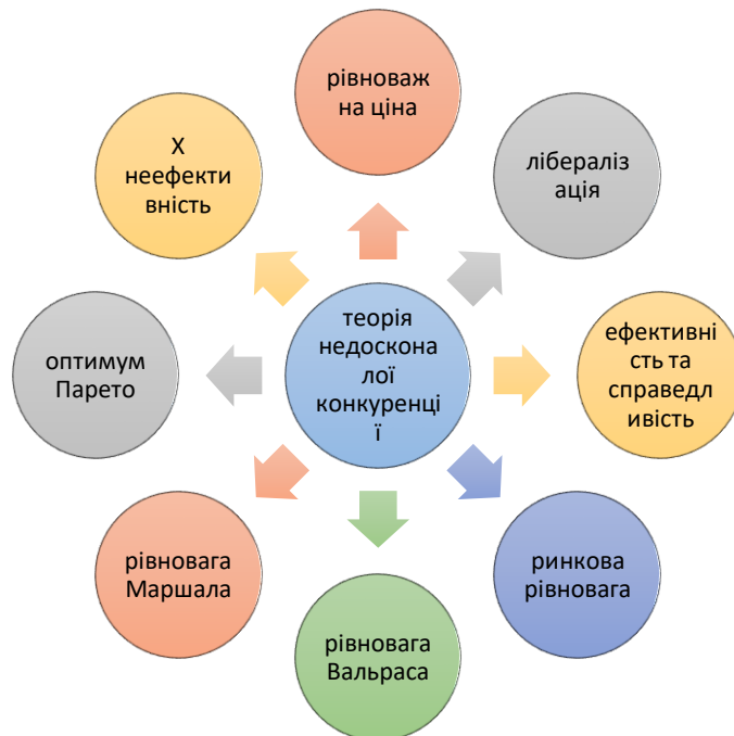
Рис. 1 Концепт теорії недосконалої конкуренції за мейнстрімом

Розпочинаючи початкові дослідження концепції недосконалої конкуренції, здається, що ви обмежується вузьким колом питань, які є дослідженими і враховуючи теоретичні надбання, дозволяє оцінити будь який ринок. Таким першим колом питань є, що сутність недосконалої конкуренції є її форми, які загальновідомі і достатньо розкриті в мікроекономічному аналізі. Цими формами є олігополія, монополістична конкуренція, дуополія як форма олігополії та в якійсь мірі монополії, яку теж іноді автори відносять до форм недосконалої конкуренції. Другим етапом дослідження є вивчення умов існування тієї чи іншої форми недосконалої конкуренції за Дж. Стігліцом, який виділив п'ять умов існування досконалої конкуренції, за умов відсутності цих умов ринок вважається недосконалим. Цими умовами є достатньо велика кількість продавців та покупців на ринку, симетрична інформація, відсутність бар'єрів вхідних та вихідних, та відсутність взаємозалежності між продавцями і останньою являється однаковість/схожість продукції.