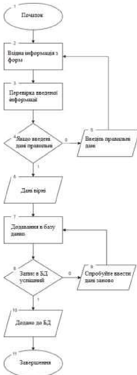
Рисунок 1 – Блок-схема алгоритму додавання інформації про книгу в базу даних

Алгоритм збереження інформації про книгу в базі даних зображено на рис. 1.