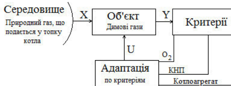
Рис. 2. Модель адаптації (при зміні об'єкта)

На рис. 2 розглянемо узагальнену структурну модель зовнішньої адаптації (при зміні об'єкту).