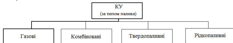
Рис.3. Класифікація КУ за типом палива

Відразу зазначимо з якими типами КУ можлива "зовнішня" адаптація і, як наслідок, адаптація в цілому (рис. 3)