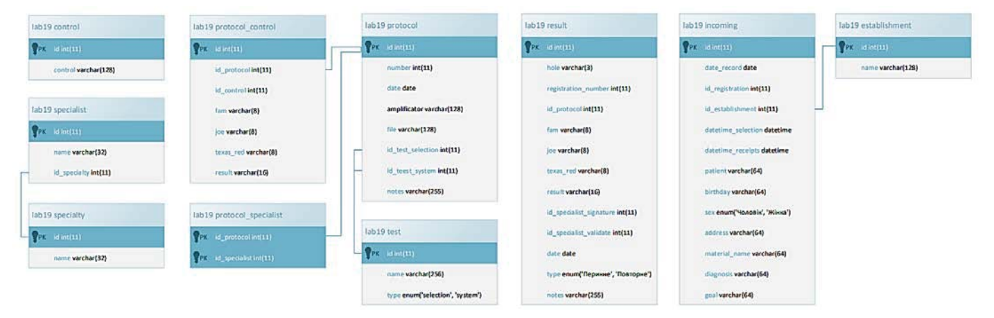
Рис. 1. - Схема бази даних додатку Проти-Covid 19

Усі результати мають бути закріплені за певним протоколом, який теж має свої показники, що зберігаються у таблиці «protocol».