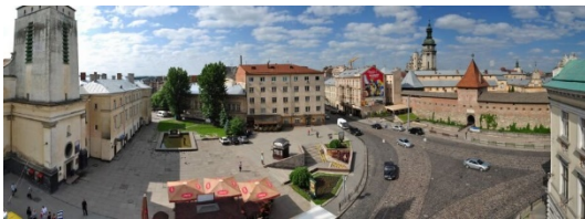
а) площа Митна, м. Львів, 2017 р.

Згідно цього поняття для нормального функціонування громадського простору потрібна територія, елементарна інфраструктура і самі люди. Але розглядаючи деякі приклади (рис. 1) можна помітити, що для залучення останньої складової громадського простору – особи, недостатньо лише вільної ділянки і базового благоустрою (певний тип озеленення, якісна покрівля, доступність території тощо).