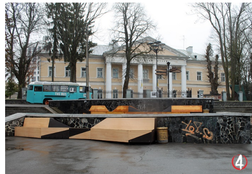
б) простір біля Краєзнавчого музею, м. Рівне, 2019 р.