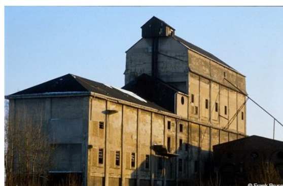
Раніше: шахта Zeche Maximilian (Гамм)