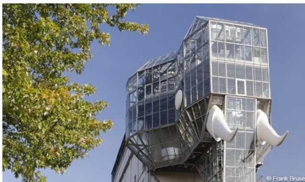
Сьогодні: Максимилянський парк (Гамм)

Більшість територій мають історичне підґрунтя, тому врахування історії. З одного боку, необхідно проявити повагу до людей та їх спогадів, а з іншого – зробити все можливе для того, щоб оновлений проект сподобався місцевим жителям. Той же нюанс враховували і «вершители» відомої ревіталізації всього Рурського регіону. Щоб проявити повагу до тисяч шахтарів, шахти не знищувалися, а були модернізовані в культурні майданчики [7].