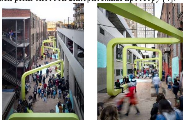
Рисунок 3 – «Міська нитка», арх. SPORTS, Чаттануги, Техас

Проект «City Thread» («Міська нитка») – переможець міжнародного конкурсу дизайну Passageways 2.0, який перетворив колишню занедбану алею площею 576 м 2 у центрі міста Чаттануга, штат Теннессі в активний громадський простір (рис. 2). Він служить соціальним зв'язком, де люди можуть збиратися як на унікальні публічні заходи, так і на неформальні зустрічі. Коридор відривається від навколишньої міської тканини за допомогою неоновозеленої, зігзагоподібної сталевий трубки та пофарбованих графічних поверхонь. Ці деталі також функціонують для сегментації простору на різноманітні менші анклавів або "міські кімнати", які підтримують різні види діяльності. Крім того, його дизайн призначений для того, щоб дозволити всім користувачам відкривати різні способи використання простору [4].