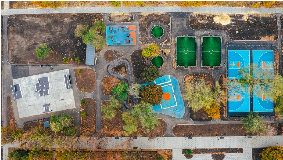
Рисунок 4 – Ревіталізований бульвар Юр'єва зі створеним урбан-парком, м. Харків

Бульвар Юр'єва — це сквер посеред району з багатоквартирними будинками, тут живе багато молоді. З'ясували, що раніше тут був загальний корт з асфальтовим покриттям для футболу і баскетболу, невеликий комплекс для занять спортом на вулиці, саморобний скейт-парк, а також це місце завжди користувалося популярністю для активного дозвілля у молоді району (рис. 4). Піша доступність і відкритість заохочував людей до заняття спортом. Але останнім часом цей простір використовувався виключно для того, щоб пройти до громадського транспорту або до торговельних майданчиків. Зараз це точка тяжіння молоді, тут відбувається постійний рух креативної енергії. Якщо поглянути на сквер в цілому, то основна маса людей зосереджена саме в урбан-парку [6].