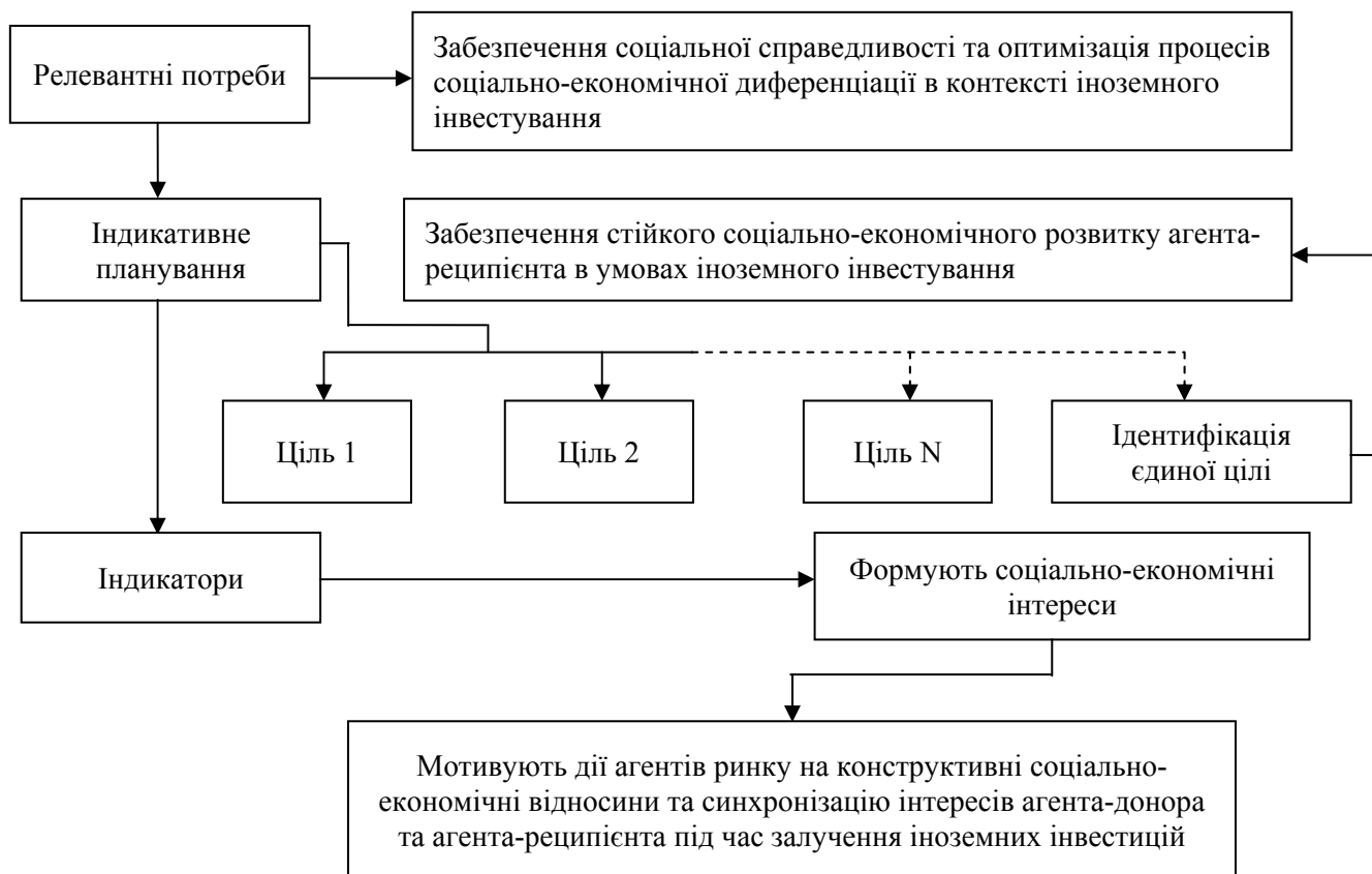
Рис. 2. Інституційна модель динамічного індикативного планування в контексті залучення іноземних інвестицій

Взагалі, на нашу думку, державний контролінг іноземних інвестицій дозволяє своєчасно ідентифікувати потенційні прояви дисфункційних економічних процесів, а також створює умови для накопичення інформації стосовно розвитку екзогенних детермінант.