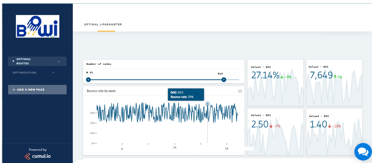
Fig. 2. An example of dashboard operation with the results of calculating the optimal route of a grain elevator for a given batch of grain using the developed intelligent technologies

To provide greater visibility of the decision support process, the process operator is shown not only the final calculation results using formula (4), but also the optimal action diagram. By scrolling, you can select the required number of nodes on the route. On the graph, you can view information about the corresponding node. Also, the operator will be shown the main KPIs of this route, which will allow him to make high-quality management decisions at the post (Fig. 2) [2].