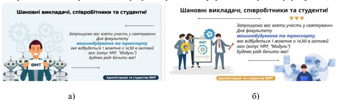
Рисунок 1 – Приклади створених візиток-запрошень на ФМТ

Про цю програму я дізнався приблизно рік тому, з'явилося бажання більш глибоко її використовувати. Вступивши до ВНТУ на перший курс машинобудівного факультету, створив два типи запрошень до святкування «Дня факультету машинобудування та транспорту» (рис. 1, а, б).