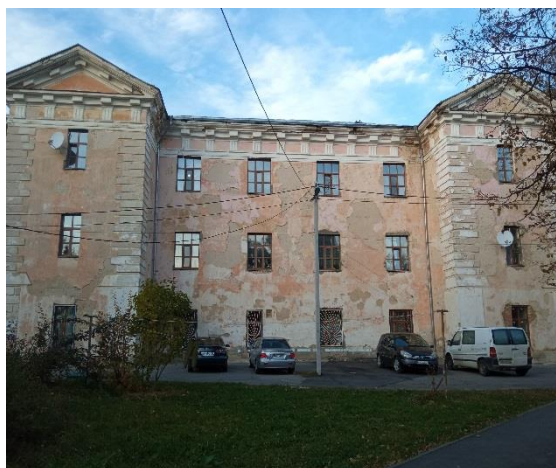
Рисунок 2 – Сучасний вигляд палацу. 2022 р.

Сьогодні, П'ятничанський парк на Вінниччині має статус пам'ятки садово-паркового мистецтва, охоронний номер – 279-М. Сьогодні на території палацово-паркового комплексу розташований Вінницький обласний клінічний ендокринологічний диспансер, а в самій будівлі палацу – адміністрація диспансеру [7].