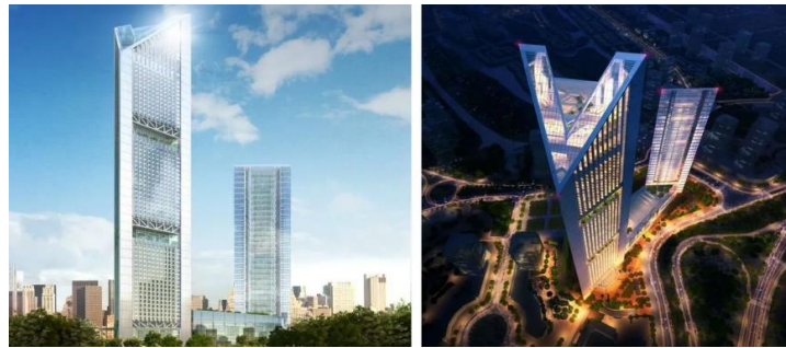
Рис. 2 – Бізнес-центру VietinBank, Арх.: Foster + Partners. Cipura City, В'єтнам. 2010 р

У китайській провінції Сичуань відбулося офіційне відкриття найбільшого окремого будинку в світі. Площа багатофункціонального комплексу The New Century Global Center в місті Ченду (Рис.1.). Загальна площа комплексу становить 1,76 млн кв.м, довжина - 500м, ширина - 400м, висота - 100м. Будівництво тривало 3 роки. У комплексі розташовані офіси, торгові площі, готелі, мистецький центр, університет, конференц-зали, кінотеатр IMAX, каток, аквапарк зі штучним пляжем. Особливість - "штучне сонце" для обігріву та освітлення. [4]