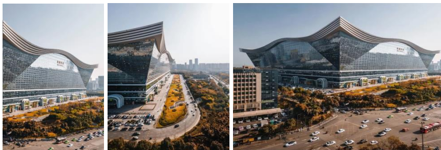
Рис.1 – Багатofункціональний комплекс The New Century Global Center в районі Тяньфу в Ченду, Китай. 2013 р

Сучасний принцип об'ємно-просторової побудови бізнес-центру полягає у створенні універсального простору, що може змінюватись за потребами клієнтів. Така організація має переваги, як-то багатofункціональність, можливість зміни характеристик і естетичний аспект з несподіваними ефектами та виразними рішеннями. [6]