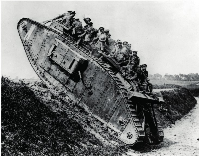
Рис. 3. Танк Mark IV з екіпажем [2, с. 48]

(Умовні позначення: Commander – командир танку, Driver – водій танку, Controls – механічне оснащення танку, Engine – двигун, Gunner – бойовий склад екіпажу танку, Drive – гусенична стрічка, Radiator – радіатор двигуна, Petrol tank – бак для пального)