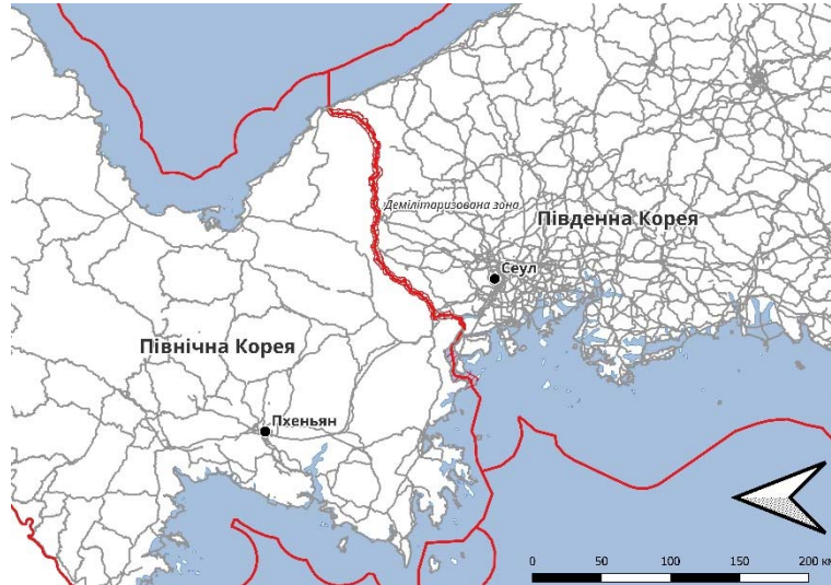
Рисунок 2 – Північна та південна Корея. Один півострів, дві країни.

Рис. 2 та 3 достатньо яскраво ілюструє протиріччя форми та функції містобудівного розвитку. Вже можна прогнозувати існуючі парадокси та перспективні конфлікти для регіонів що наведено на рисунку.