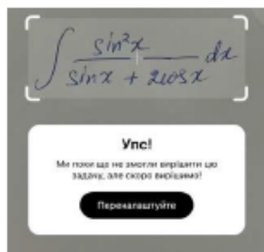
Рис. 4. Скрін відповіді додатка на можливість розв'язання інтеграла

Photomath – це мобільний додаток, який використовує фотокамеру смартфона для розпізнавання та розв'язання математичних задач. Додаток може обробляти фотографії або сканувати написані чи друквані математичні вирази. Зображення відправляється на хмарні сервери і аналізується нейронною мережею. Мережа визначає відповідну формулу, необхідну для конкретного завдання. Користувачеві у додатку виводиться детальний алгоритм розв'язання. Та не з усіма математичними задачами додаток справляється. Наприклад завдання, яке розв'язав онлайн-калькулятор MathDF, Photomath виконати не зміг (рис 4.)