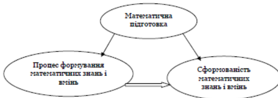
Рис. 1. Схематичне зображення математичної підготовки студентів технічних спеціальностей.

Математична підготовка становить діалектичне подання процесу формування математичних знань та вмінь і результату цього процесу – їх сформованість на належному рівні. (рисунок 1).