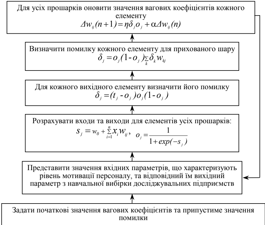
Рис. 1. Алгоритм зворотного розповсюдження помилки для оцінювання рівня мотивації на підприємстві

Вони виконують проміжне перетворення сигналів таким чином, що вихідний нейрон-класифікатор отримує на свої входи вже лінійно розподілені множини.