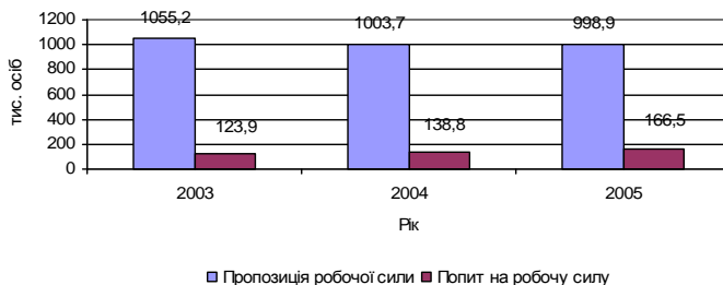
Рис. 1.2. Попит та пропозиція на робочу силу

Незбалансованість попиту та пропозиції на ринку праці (рис.1.2, на 01.01) викликає таке явище як безробіття, яке є однією з визначальних факторів зубожіння переважної частини населення, поширення бідності, гальмує соціально-економічний рівень розвитку держави, знижує рівень зайнятості, призводить до міграції населення.