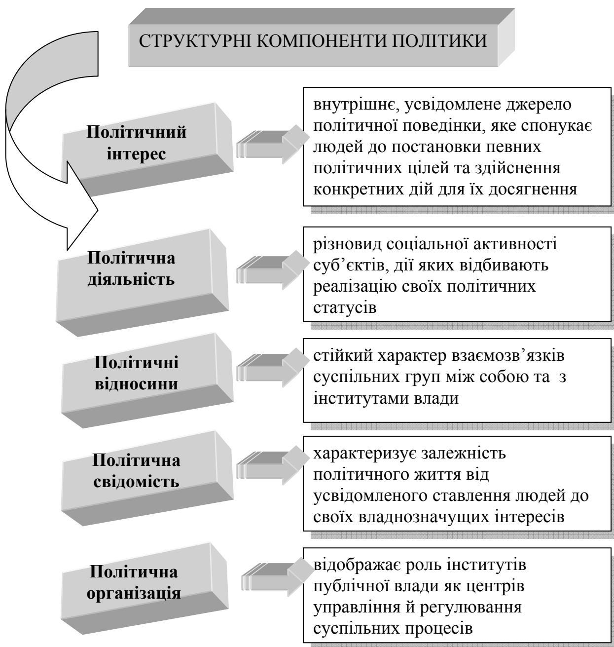
Рис. 2.1 Структурні компоненти політики

СТРУКТУРА ПОЛІТИКИ наочно відображена на рис. 2.1.