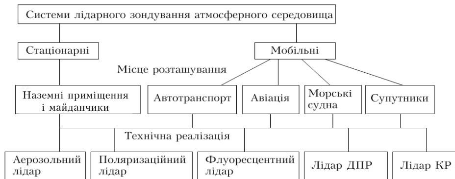
Рис. 1 Класифікація систем лідарного зондування атмосфери

В основі методів лазерного зондування лежать такі процеси взаємодії лазерного випромінювання з речовиною: аерозольне розсіяння (АР); молекулярне розсіяння (МР); комбінаційне розсіяння (КР); флуоресценція (люмінесценція), у тому числі і резонансна; резонансне розсіяння (РР) і резонансне поглинання (РП); диференціальне поглинання і розсіяння (ДПР). Класифікація систем лідарного зондування атмосфери приведена на рис. 1. Стационарні системи, встановлюються в приміщеннях або на спеціально обладнаних майданчиках, володіють високим енергетичним потенціалом — мають прийнятні об'єкти великих розмірів і лазери зі значною енергією випромінювання. Вони забезпечують великий інтервал дальності зондування, але при цьому вони є громіздкими, дорогими системами і мають обмежену локальну просторову область вимірювань, прив'язану до точки їх розміщення. Основною їх перевагою, є можливість одночасного моніторингу декількох атмосферних параметрів з високою чутливістю. Мобільні лідари розміщені на рухомих засобах мають розширені можливості для моніторингу атмосфери на значній території, особливо в разі їх установки на аерокосмічних носіях.