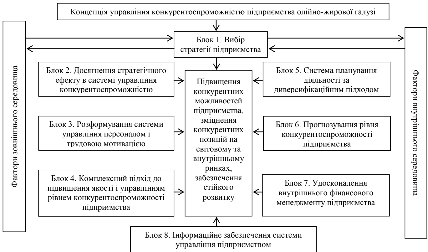
Рисунок 1 – Блок схема організаційно-економічного механізму управління конкурентоспроможністю підприємства

Блок 5. Система планування діяльністю за диверсифікаційним підходом передбачає: проведення політики диверсифікації основної продукції з урахуванням динаміки змін кон'юнктури ринку; розробку і забезпечення взаємозв'язку перспективних, річних і оперативних планів продажів і прибутку; використання перспективного бізнес-планування; формування перспективних і річних бюджетів витрат; удосконалення методів планування й аналізу собівартості продукції; розробку організаційно-економічних заходів щодо виконання перспективних, поточних і оперативних планів.