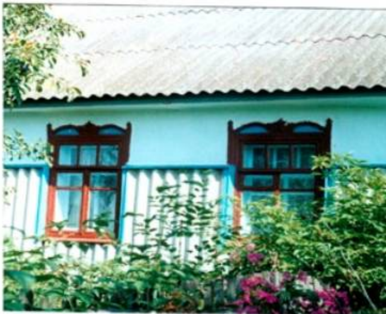
Рис. 6. Трактування стіни, захищеної шифером в с. Пиків

Витончене відчуття народними майстрами властивостей будівельних матеріалів, набуте ними в результаті колективного досвіду дозволяло не тільки раціонально застосовувати матеріали, але й максимально використовувати їх виражальні якості. Отже, досягалося правдиве відображення конструктивних особливостей у зовнішніх архітектурних формах. В одному випадку це міг бути ритм горизонтальних членувань зрубу, в іншому – пластика заповненої глиняним розчином каркасної стіни, або інші прийоми. Але в усіх випадках зовнішня форма впливає з конструктивної структури споруди і визначається нею залежно від матеріалу та характеру його обробки.