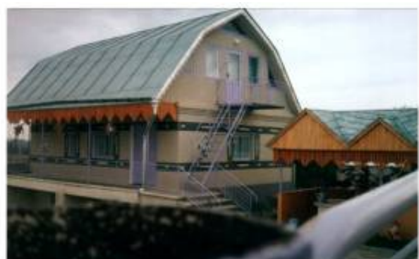
Рис. 4. Приклади формального застосування арочних форм

Яскравим прикладом поєднання конструктивних та естетичних вимог є чисто подільське влаштування виносів даху з використанням так званих „п'ятнарів”. Це досить міцні гілки, що виходять з площини стіни – від дерев'яних стовпів каркасу. По верху цих гілок опирається виносна платва. В більш давньому