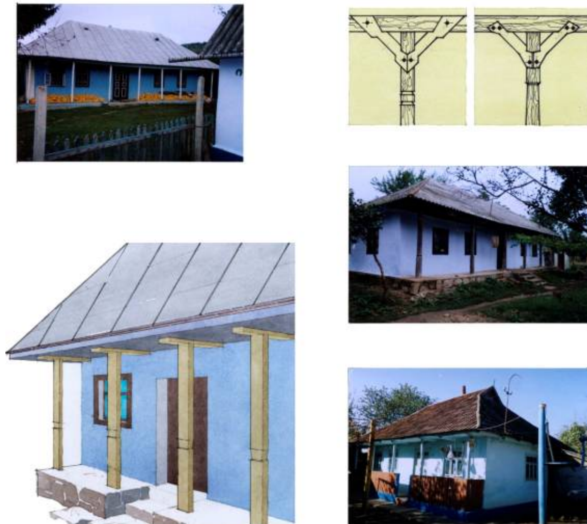
Рис. 2. Галерейки на Східному Поділлі (Могилів – Подільський район)

Часто стовпи галерейок ставляться на підвищену кам'яну терасу, що відповідає практичним інтересам і одночасно покращує візуальне сприйняття будівлі. Інколи тераса закривається огороженою з дерев'яних вертикальних дощок, яким надають цікавої форми, яка характерна виключно для подільського народного зодчества. Така дерев'яна огорожа є також відображенням органічної єдності функціональних потреб, та естетичної довершеності. Форма окремих елементів огорожі з дерева впливає з технологічних особливостей обробки матеріалу сокирою та ножівкою, а також традиційною мистецькою уявою народних подільських майстрів.