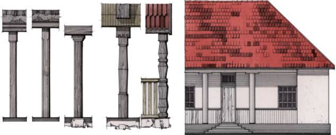
Рис. 3. Мистецьке оздоблення дерев'яних колон в м. Вінниці (за П. Юрченком – поч. 20 ст.)

Зображена будівля, очевидно, була багатоквартирним містечковим житлом торговельного чи іншого громадського призначення. Фасад цієї будівлі має просту лаконічну форму. Стовпи трактовано витримано і спрощено.