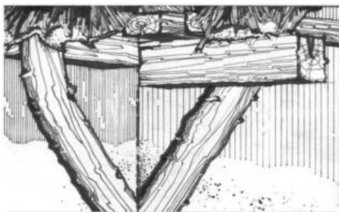
Рис. 5. Винос даху за допомогою „п’ятнарів”

будівництві на слупи (вертикальні стійки) відбирали дерево, яке мало природне відгалуження у вигляді гілок. Такі „п’ятнарі”, як правило, встановлювали по рогах хати над вхідними дверима або ж ритмічно розташовували вздовж чільної сторони. Така цікава особливість каркасу подільських стін описана і зображена Т. Косміною [2]. Один із студентських загонів тодішнього Київського художнього інституту, перебуваючи на обмірній практиці у селі Шкальня Могилів-Подільського району зафіксував застосування „п’ятнарів” у народному житлі (рис. 5). Бачимо чудовий приклад поєднання властивостей природних матеріалів та конструктивних особливостей будівлі.