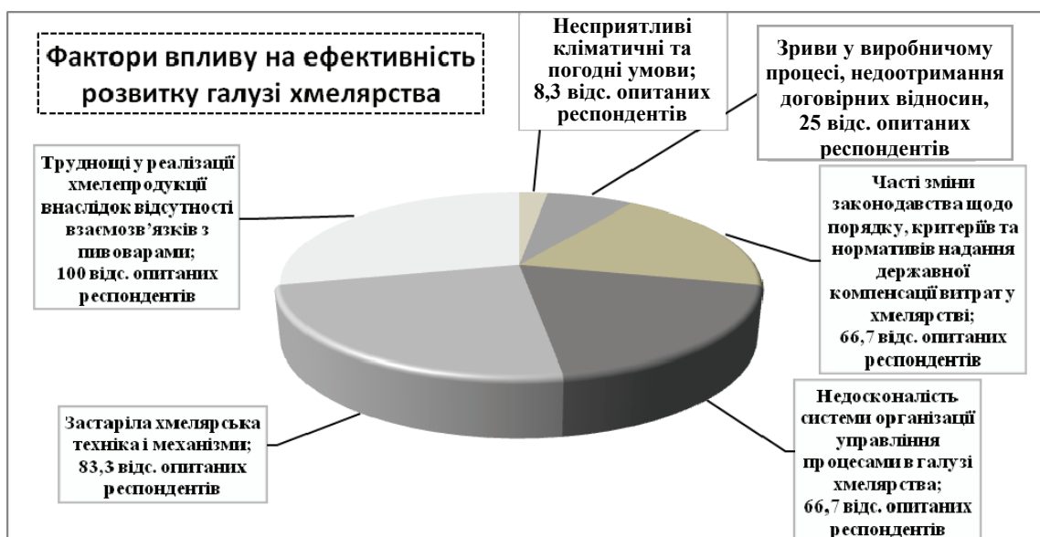
Рис. 1. Оцінка ефективності факторів, які впливають на розвиток галузі хмелярства

Рівень впливу основних факторів на розвиток галузі хмелярства за оцінками керівників хмелярських господарств у порядку зростання впливу показано на рис. 1.