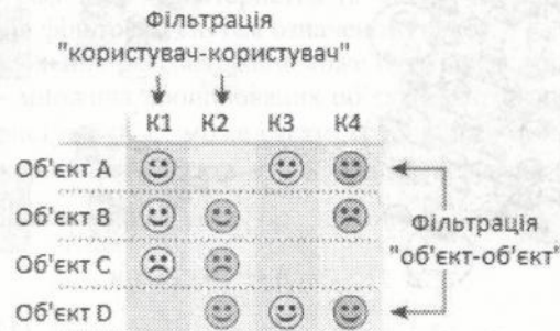
Рис.2. Порівняння фільтрації «користувач-користувач» та «об'єкт-об'єкт»

Одним з відомих прикладів інтелектуального аналізу даних у рекомендаційних системах є виявлення асоціативних правил, або кореляція «об'єкт-об'єкт». Цей метод виявляє об'єкти, які часто зустрічаються в асоціації з позиціями, до яких користувач проявив інтерес. Для обчислення кореляції «об'єкт-об'єкт» рекомендаційні системи зазвичай використовують поточні потреби, а не історичні дані користувача.