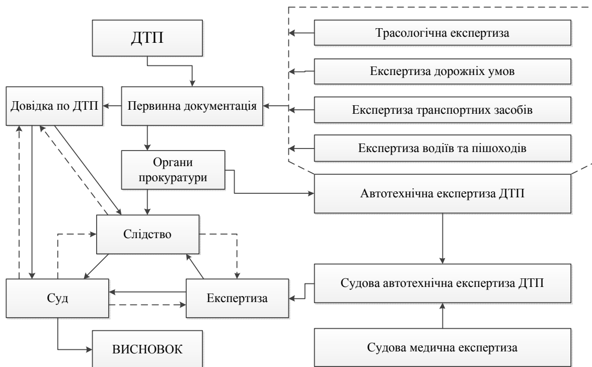
Рисунок 1 – Взаємодія ланок системи «слідство – експертиза – суд» в дослідженні механізму ДТП

Дослідження механізму ДТП повинно проводитись комплексно, щоб кожна ланка, «слідство - експертиза - суд - прокуратура» мала одну ціль – об'єктивне відновлення обставин ДТП, виявлення істинного винуватця в скоєному і винесення по факту ДТП об'єктивного рішення у відповідності з діючим законодавством. На рисунку 1 показані зв'язки окремих ланок системи «слідство - експертиза - суд» при розслідуванні ДТП, при цьому розслідування знаходиться під контролем прокуратури. Певне місце в цій діяльності може займати судова експертиза (на стадії як попереднього, так і судового розслідування).