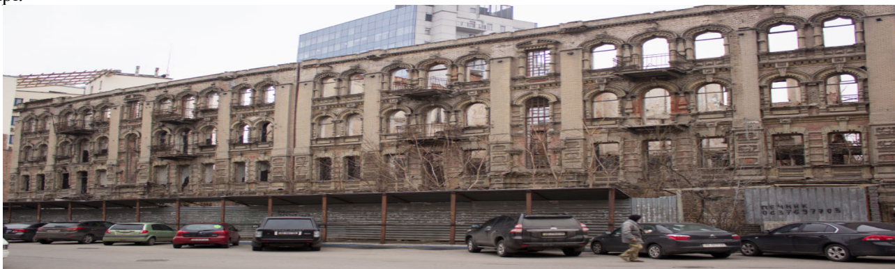
Рис.1 – Фото на теперішній час

Практичним використанням реконструкції можна представити на прикладі дома Померанцева в Дніпрі.