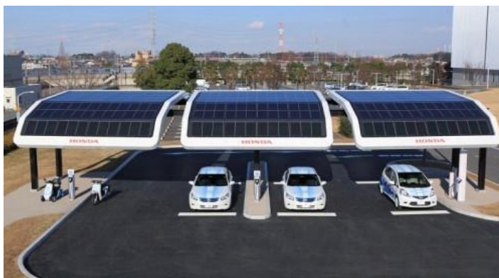
Рисунок 1 – Заправна станція компанії Honda для електро автомобілів і скутерів на сонячних батареях з системою накопичення енергії

Серед перспективних технологій є навіть розробка, що отримала назву «плаваючий фотогальванічний електролізер», він здатний виробляти водень за рахунок сонячної енергії [8]. Водень також можна використовувати в якості палива. Також цікава технологія, де електромобілі зможуть заряджатися під час руху [9]. Також створюються зарядні станції для електромобілів [18], що містять на даху лише сонячні батареї (рис. 1).