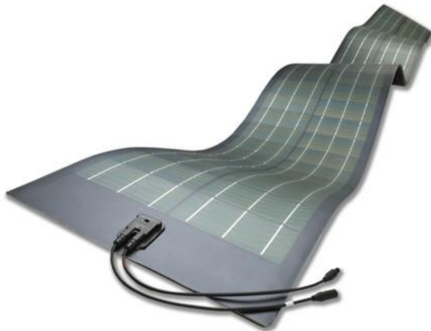
Рисунок 4 – Гнучкі сонячні батареї

Так само існують і гнучкі сонячні батареї, вони виготовляються на основі аморфного кремнію товщиною в 0,5-1 мкм. Однак ККД таких батарей не перевищує 12%, не дивлячись на те, що вони мають підвищене фото поглинання.