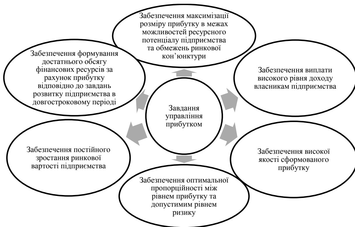
Рис. 1. Завдання управління прибутком

Принцип інтеграції із загальною системою управління підприємством передбачає узгодженість цілей системи управління прибутком і стратегічних цілей розвитку підприємства, адже процес управління прибутком охоплює всі аспекти діяльності підприємства та є результатом його фінансово-господарської діяльності.