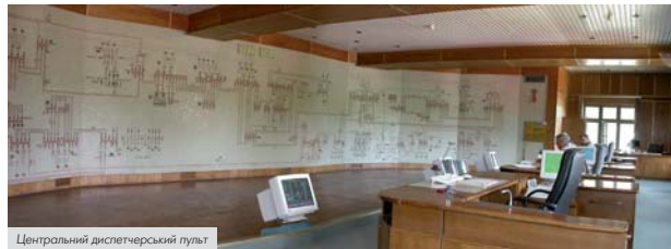
Центральний диспетчерський пулт

У Кіровоградських МЕМ відіграють особливу роль приміщення на підстанціях «Рудна-330», «Пташенка-330», «Ферославна-330», «Кіровоград-330», «Гірська-330».