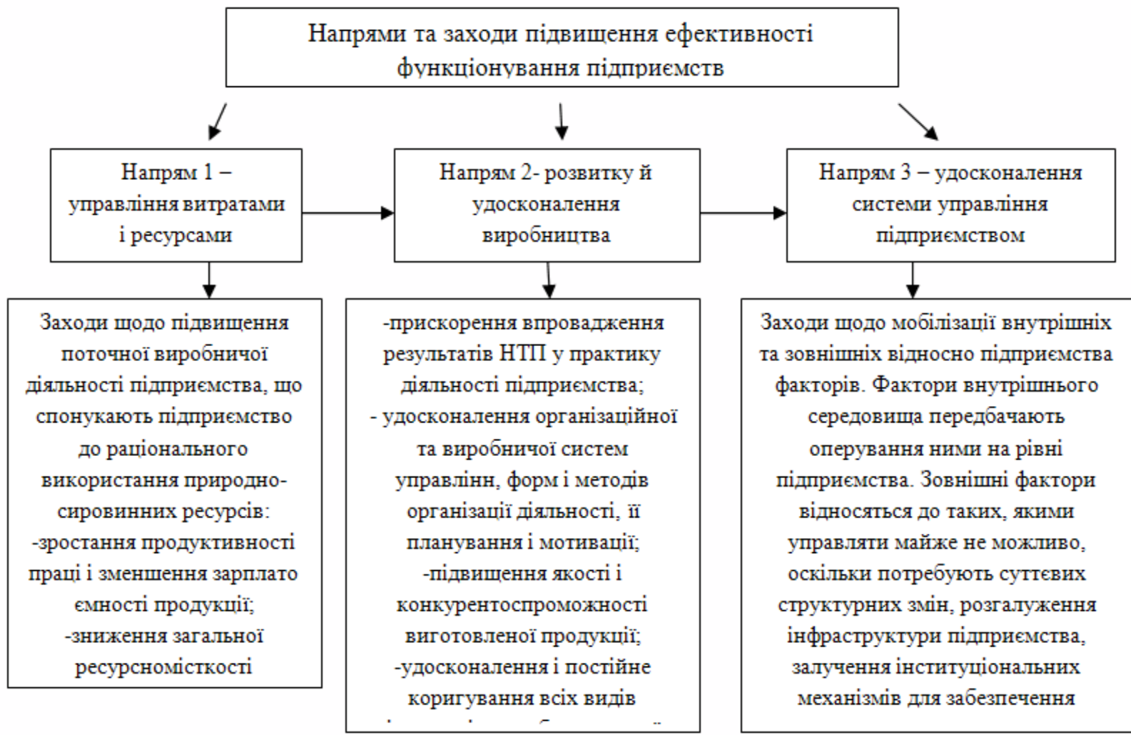
Рисунок 2 – Напрями підвищення ефективності роботи підприємств