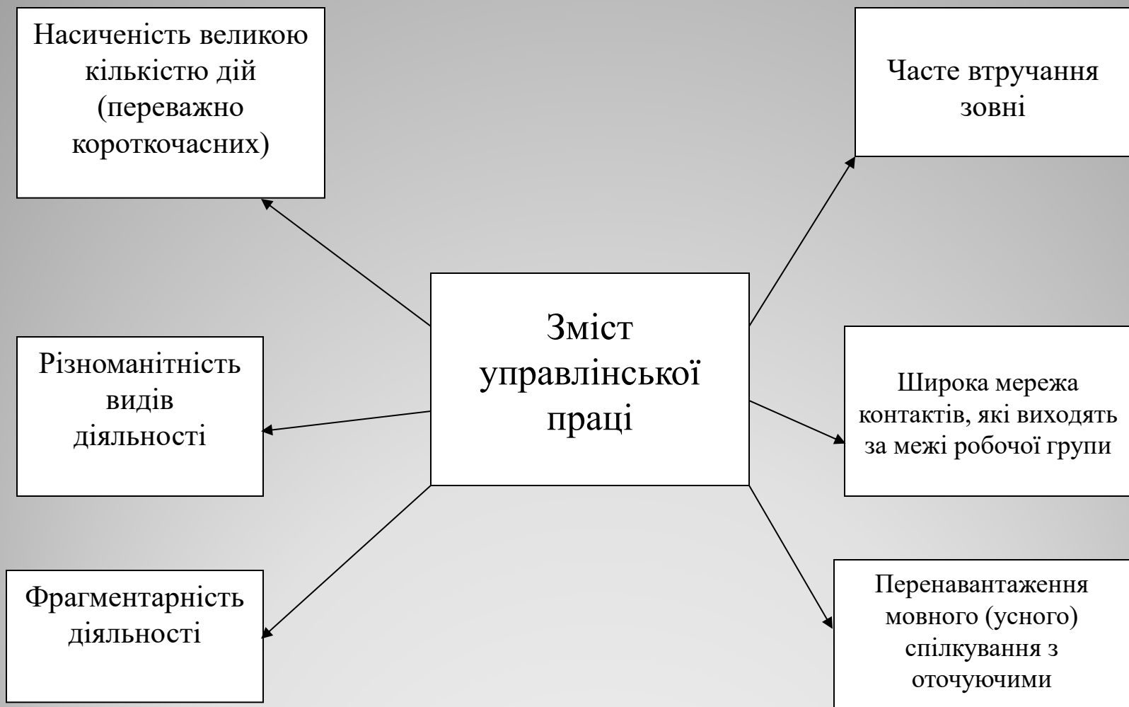
Рисунок 1-Характеристика змісту управлінської праці