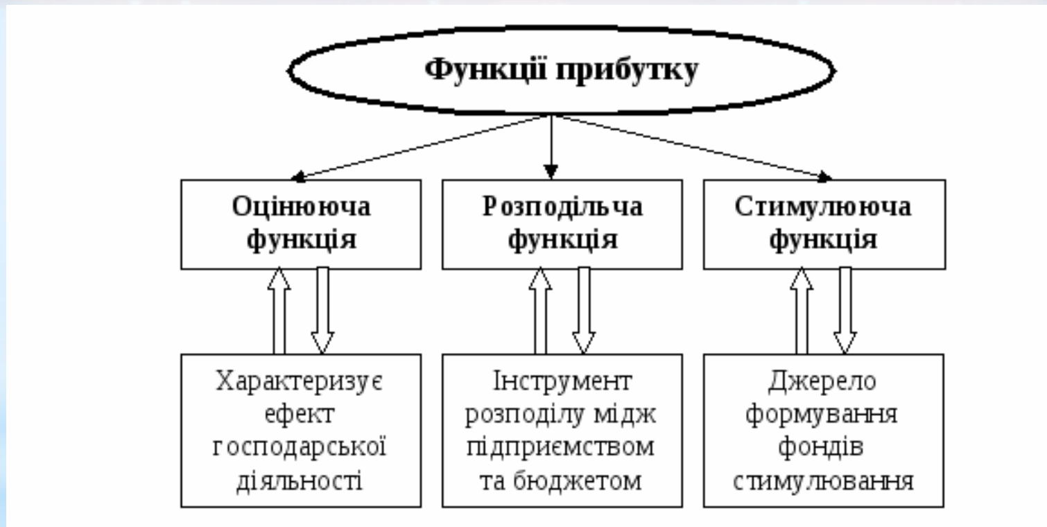
Рисунок 1.3 - Основні функції прибутку на підприємстві

* Прибуток - найважливіша фінансова категорія. Він є показником, що характеризує ефективність виробництва, обсяг і якість виробленої продукції, стан продуктивності праці, рівень собівартості, та відображає фінансовий результат господарської діяльності підприємства,