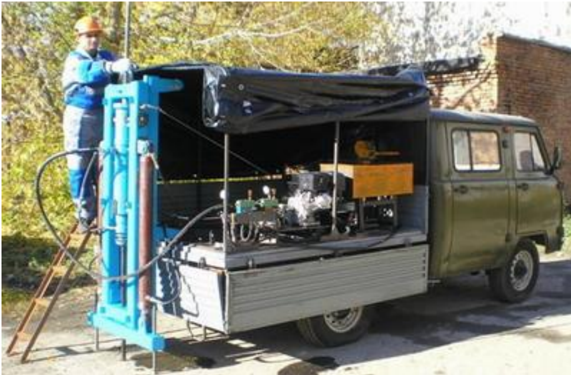
Рисунок 1 – Установка для динамічного зондування

ТОВ «Експрестест», м.Новосибірськ, запропонувало нову технологію динамічного зондування. [8] Вперше для занурення штанги з зондом в ґрунт застосовується не система підйому і скидання вантажу за допомогою лебідки, а спеціальна гідродарна машина з регульованою енергією удару (рис. 1). В ГОСТ 19912-2012 для динамічного зондування в різних типах ґрунтів допускається застосовувати три типи обладнання з масою вантажу від 30 до 120 кг. В пропонованому обладнанні система регулювання енергії удару дозволяє виконувати зондування у всіх типах ґрунтів. Установка монтується на машині УАЗ 39094. Маса в спорядженому стані близько 3 тонн. Установка повністю механізована і автоматизована.