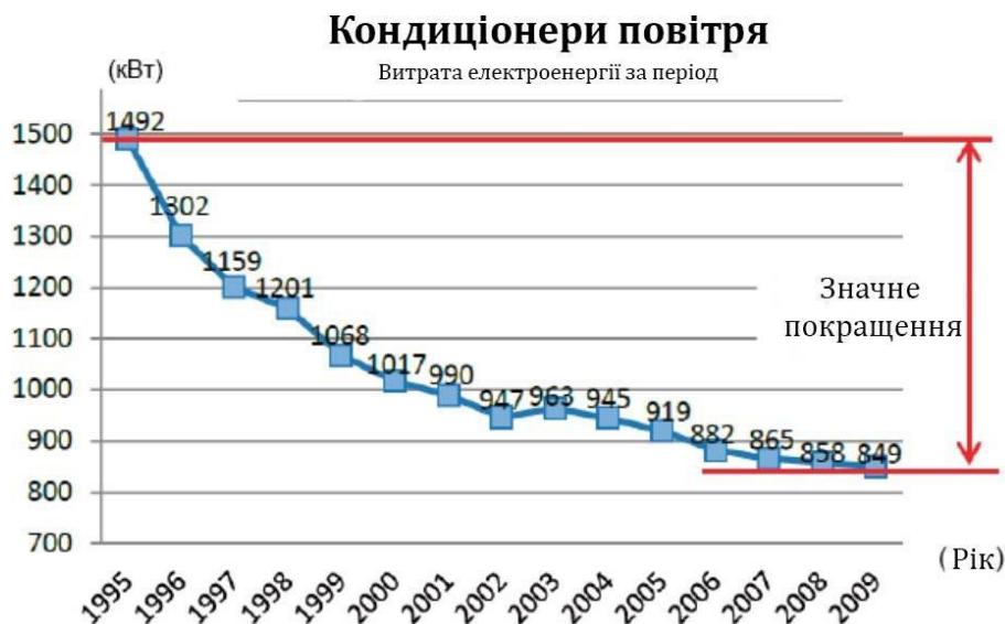
Рис.2 Енергоспоживання побутових кондиціонерів

Однією з найбільш важливих технологій, представлених в цих секторах, є технологія перенесення енергії для опалення, охолодження та холодильного обладнання. Її іноді називають тепловим насосом, тому що вона передає теплову енергію [5]. Японія дала величезний поштовх розвитку високоефективної технології теплопереносу, застосувавши її в кондиціонерах, холодильниках, водонагрівачі та інших пристроях. На рис. 2 представлені результати застосування енергоефективних кондиціонерів повітря, в яких використана не тільки технологія теплового переносу, але високоефективна система управління за допомогою перетворювачів, що працюють з урахуванням даних вимірювання навколишнього середовища, включаючи температуру. Такі кондиціонери переважають по всій Японії.