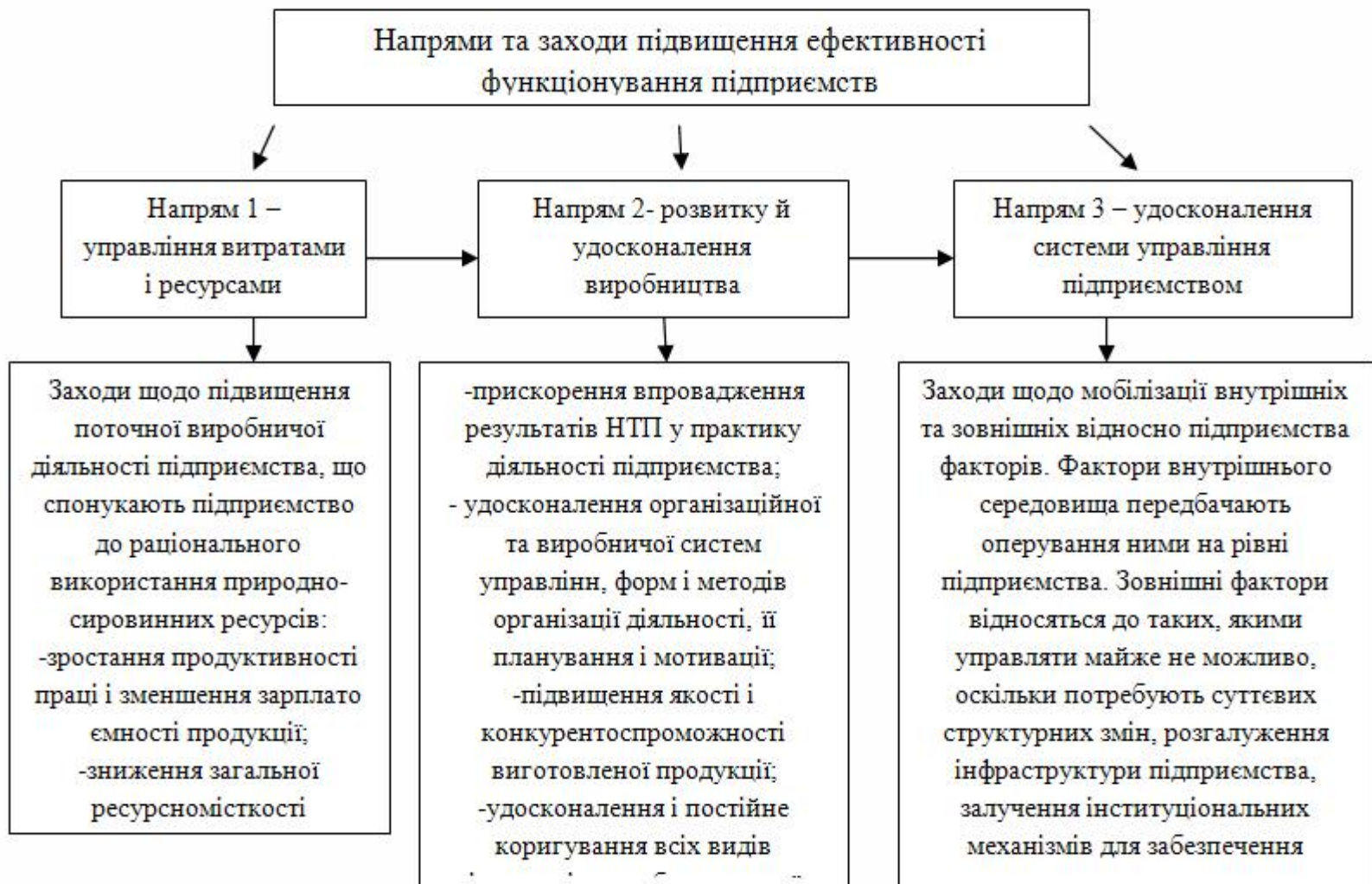
Рисунок 2 – Напрями підвищення ефективності роботи підприємств