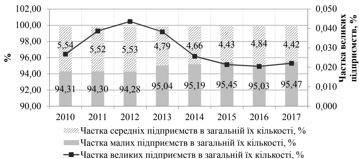
Рис. 3 Зміна структури підприємств України за їх розмірами

Тенденція до зростання частки малого бізнесу в структурі підприємницького сектору України протягом останніх років (незначне зниження на 0,44 % в 2016 році порівняно з попереднім роком) має важливе значення для економіки країни, оскільки саме мале підприємництво є досить гнучким і швидко адаптується до змін зовнішнього середовища, вимог міжнародного поділу праці зокрема, що при вмілому регулюванні та підтримці може стати дієвим інструментом перебудови та розвитку економіки в цілому (рис. 3).