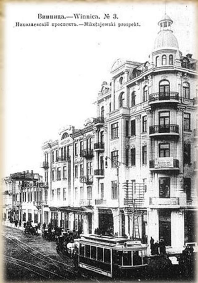
Винница.—Winnica. № 3. Николаевский проспект.—Mikołajewski prospekt.