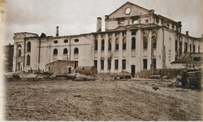
Музично-драматичний театр Theatre of Music and Drama