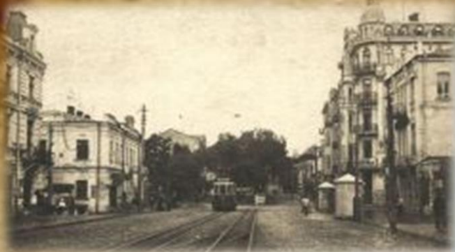
Вінниця, 1901 рік. На злі. Трамвай рухається вздовж вулиці Мухоморова.