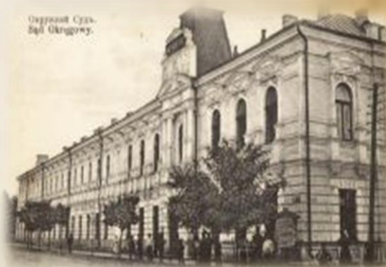
Судовий Суд всего Округу.

Микола Оводов дотримувався ідеї, що Вінниця – це правдешній культурний, економічний та політичний центр Східного Поділля. Час його правління став часом перетворення Вінниці з відсталого занедбаного провінційного містечка Російської імперії в сучасне європейське місто.