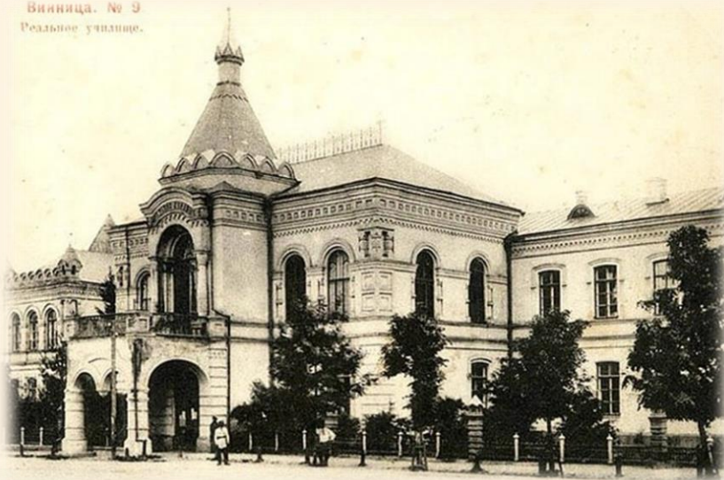
Винница. № 9 Реальное училище.