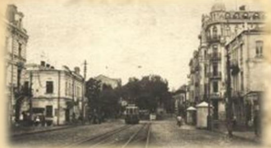
Wroclaw Pół. gaz.