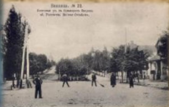
Вінниця, 1922 рік. Вулиця 29, 30, 31, 32, 33, 34, 35, 36, 37, 38, 39, 40, 41, 42, 43, 44, 45, 46, 47, 48, 49, 50, 51, 52, 53, 54, 55, 56, 57, 58, 59, 60, 61, 62, 63, 64, 65, 66, 67, 68, 69, 70, 71, 72, 73, 74, 75, 76, 77, 78, 79, 80, 81, 82, 83, 84, 85, 86, 87, 88, 89, 90, 91, 92, 93, 94, 95, 96, 97, 98, 99, 100.