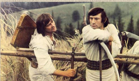
Іван Миколайчук та Богдан Ступка у фільмі Юрія Ілленка «Білий птах з чорною ознакою», 1971 р.

Свого «птаха» у кіно Ступка впіймав у 30 років. 1971 року стартувала кінематографічна кар'єра Богдана Ступки, і з першої ролі його ім'я спалахнуло з потужною силою. Йдеться про Ореста Дзвонаря у фільмі Юрія Ілленка та Івана Миколайчука «Білий птах з чорною ознакою».