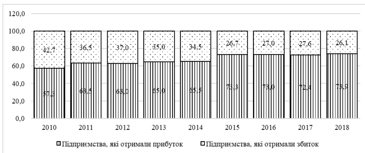
Рис. 2. Чистий прибуток промислових підприємств по Україні в цілому

Якщо досліджувати чистий прибуток промислових підприємств по Україні в цілому, можна помітити позитивну динаміку зростання тих промислових підприємств, які отримали чистий прибуток та одночасно скорочення підприємств, що отримали чистий збиток (рис. 2).