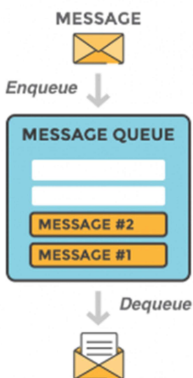
Рисунок 1. Общая схема работы RabbitMQ

Менеджер очередей RabbitMQ может сохранять сообщение до тех пор пока другое приложение или сервер, которому адресовано сообщение, не подключится к кластеру и не заберет (получит) сообщение из очереди. Затем приложение-получатель обрабатывает сообщение нужным ему образом.