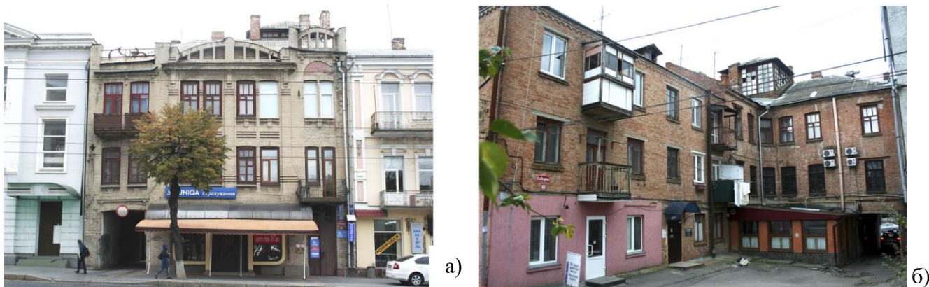
Рис. 5. Прибутковий будинок по вул. Соборній, 52. Початок ХХ століття: а) Опоряджений силікатною цеглою головний фасад; б) Позбавлений оздоблення дворовий фасад. Фото 2016р.

Одним із будинків, оздоблених силікатною цеглою, є прибутковий будинок по вул. Соборній, 52. Новий архітектурний образ був створений завдяки використанню нових форм, що походили з класичних стильових прототипів. Проте пластика значно спрощена та модернізована: пласкі карнизи, ледве помітні пілястри, строгі віконні обрамлення на чолі будинку. Незважаючи на скупість прикрас головного фасаду, будівля виглядає вишукано завдяки цегляним арочним фронтонам, струнким вікнам та металевим парапетах химерної форми. (рис.5)