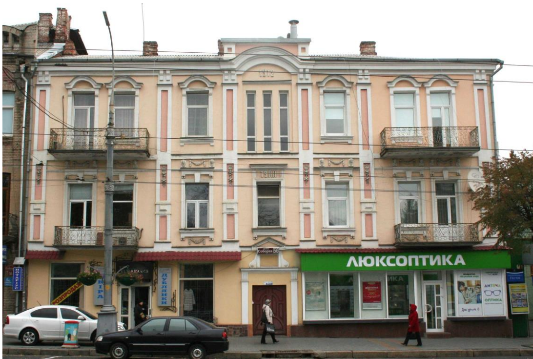
Рис. 1. Прибутковий будинок Віргіліса, 1912р. Фото 2016р.

На початку ХХ століття Вінниця зберігала риси міщанської архітектури з невиразними формами. Проте копіювання старих форм робиться більш усвідомлено, оздоблення чільних фасадів виконується системно, для задоволення естетичних потреб нових мешканців міста. [5] Прикладом використання еkleктичного стилю з елементами бароко в оформленні головного фасаду є прибутковий будинок Віргіліса по вул. Соборній, 56. Характерними елементами стильового напрямку є такі архітектурні деталі, як лучкові сандрики над вікнами третього поверху та лучковий фронтон. Над прямокутними вікнами другого поверху клинчасті перемички з замковими камнем. Карниз між другим та третім поверхами прикрашена прекрасними маскаронами. Фасад членований вертикально пілястрами з ліпним декором, що надає будівлі витонченості. (рис.1)